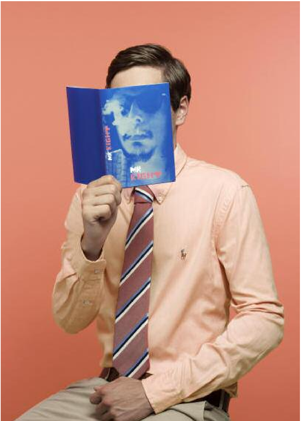
STYLING: KATRIN GERHARDY/BALLSAAL; STYLING-ASSISTENZ: JULIAN GADATSCH