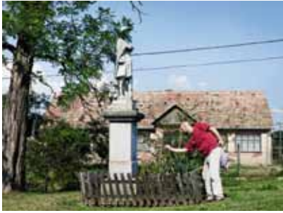
Unser Autor macht Fotos von einer deutschen Inschrift an der Straße der Roten Armee, der Hauptstraße Csibráks. In dem Dorf gibt es nur drei Straßen.