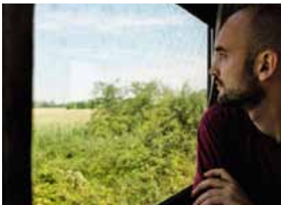
Auf seiner Reise kamen unserem Autor Zweifel: Wie würden ihn die Leute empfangen, in deren Garten er graben wollte? Und würde er etwas finden? Er spricht kein Ungarisch, also hatte er einen Dolmetscher dabei.