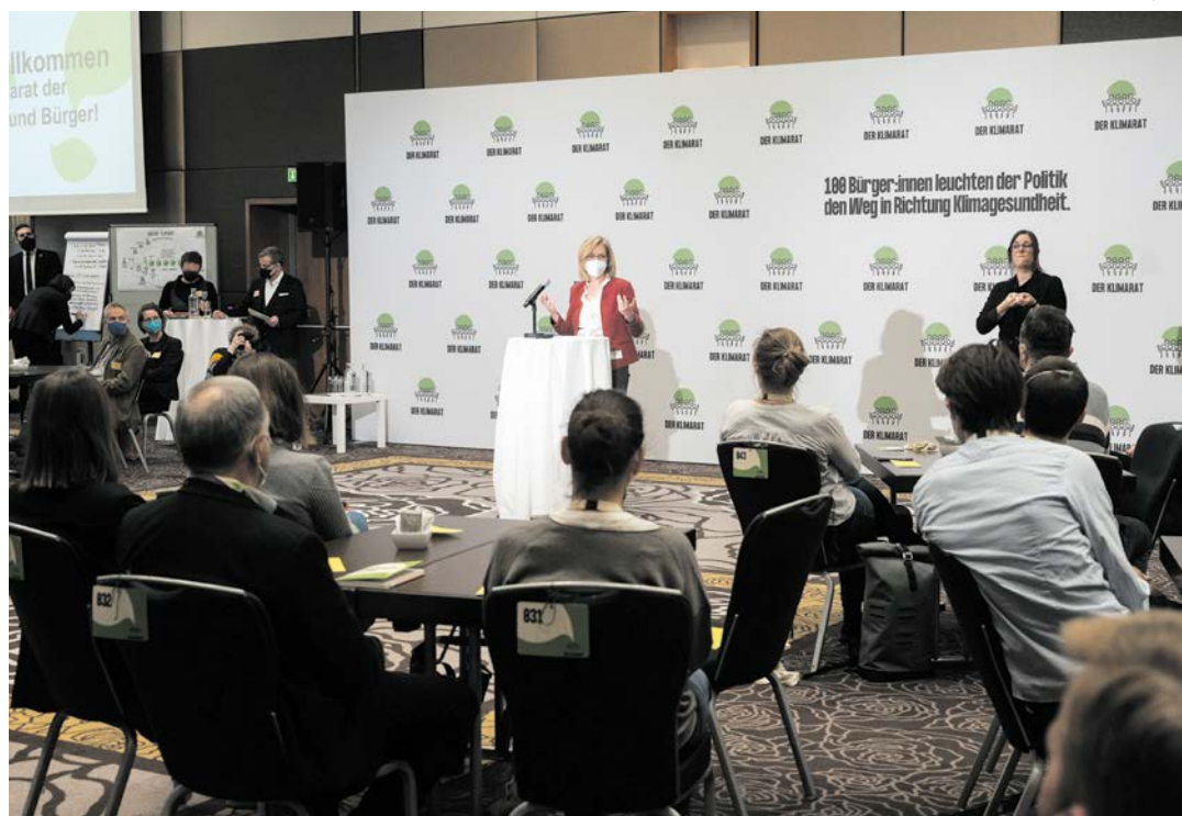
Klimaschutzministerin Leonore Gewessler spricht zu m Bürgerrat.