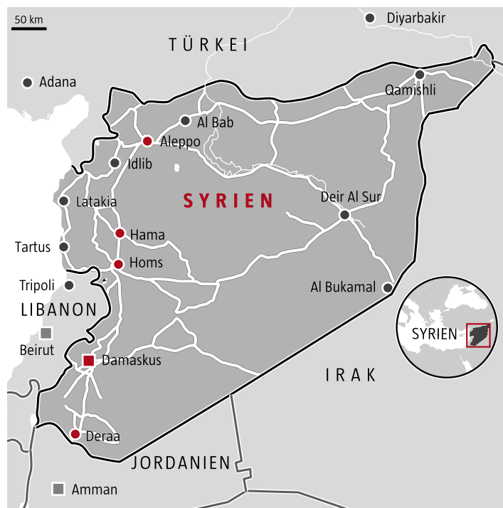
Orte des Kampfes gegen Assad: von Deraa im Süden bis Aleppo im Norden