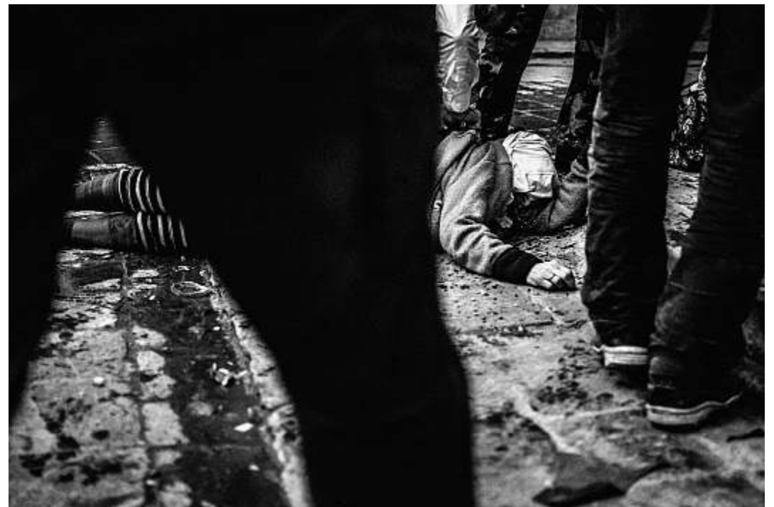
Ein Scharfschütze hat die 90 Jahre alte Frau getroffen. Sie wird im Krankenhaus sterben

■ Recht: Menschenrechtsorganisationen werfen allen Fraktionen Kriegsverbrechen vor. 900.000 Syrer flohen laut UNO ins Ausland.