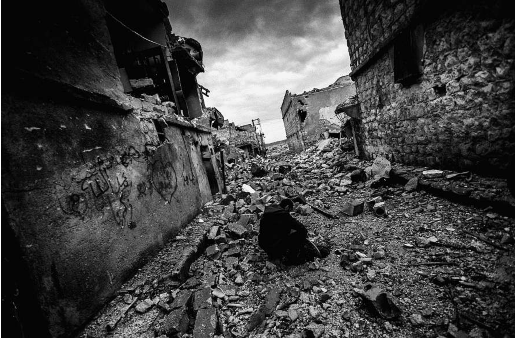
Das Viertel Sheikh Said am Stadtrand von Aleppo. Die Häuser sind alle verlassen. Das, was von ihnen übrig ist, wohnen kann hier niemand mehr