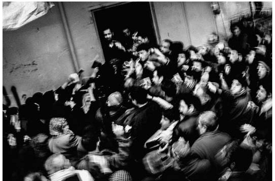
Manchmal brechen bei der Essensausgabe Tumulte aus. Dann schließen die Männer die Tore