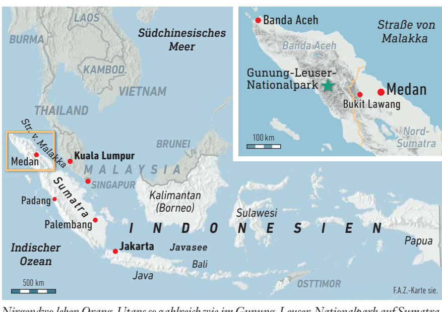
Nirgendwo leben Orang-Utans so zahlreich wie im Gunung-Leuser-Nationalpark auf Sumatra.