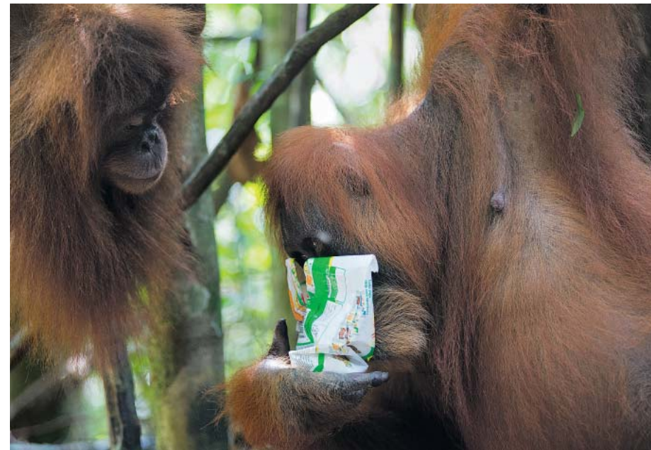
Die Orang-Utans von Bukit Lawang wurden einst ausgewildert. Doch weil sie täglich von Touristen besucht werden, sind sie halb zahm geblieben. Sie kennen kaum Scheu, die Besucher kaum Rücksicht. Mit nachhaltigem Schutz hat das nichts zu tun, nur mit hemmungslosem Gewinn.