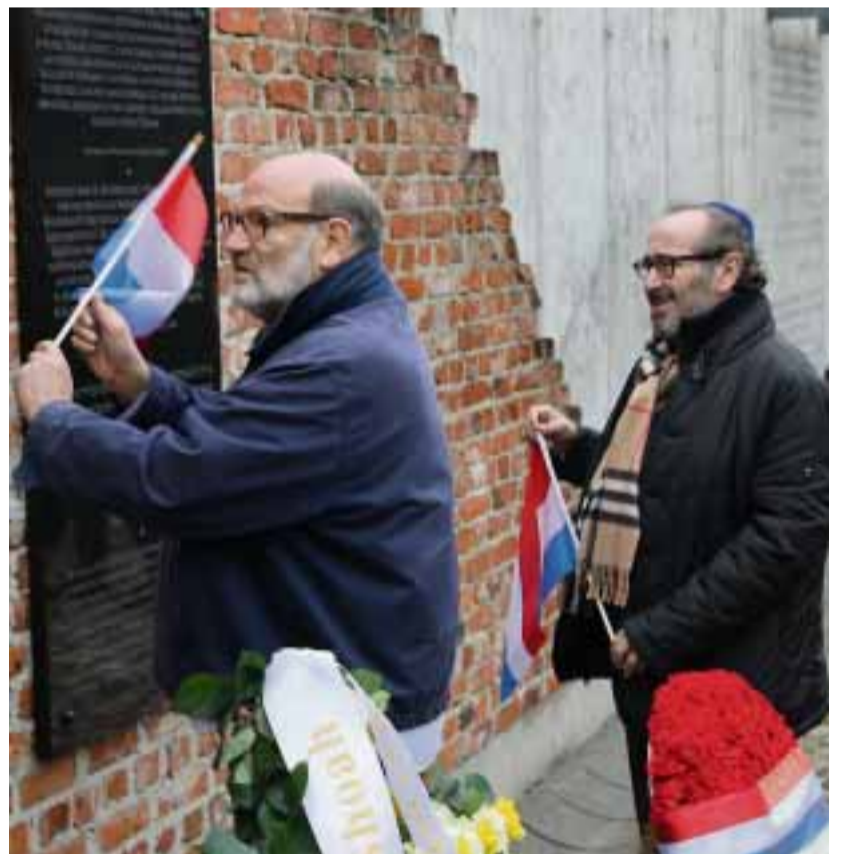
La plaque inaugurée au cimetière juif de Lodz par l'ASBL Memoshoad.