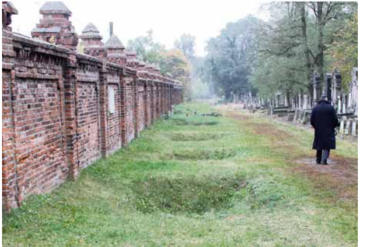
Les tombes vides destinées aux membres du commando de nettoyage, sauvés par l'avance de l'Armée rouge.

Une plaque commémorative a été inaugurée au cimetière juif de Lodz par l'ASBL MemoShoah et des gerbes déposées lors d'une cérémonie officielle en gare de Radegast.