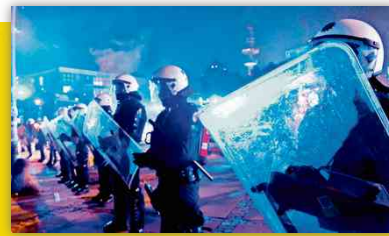
Brücke zur Welt: Polizisten unter Verdacht SEITE 7