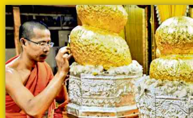
Myanmar: Schatten über dem Gold-Land SEITE W16