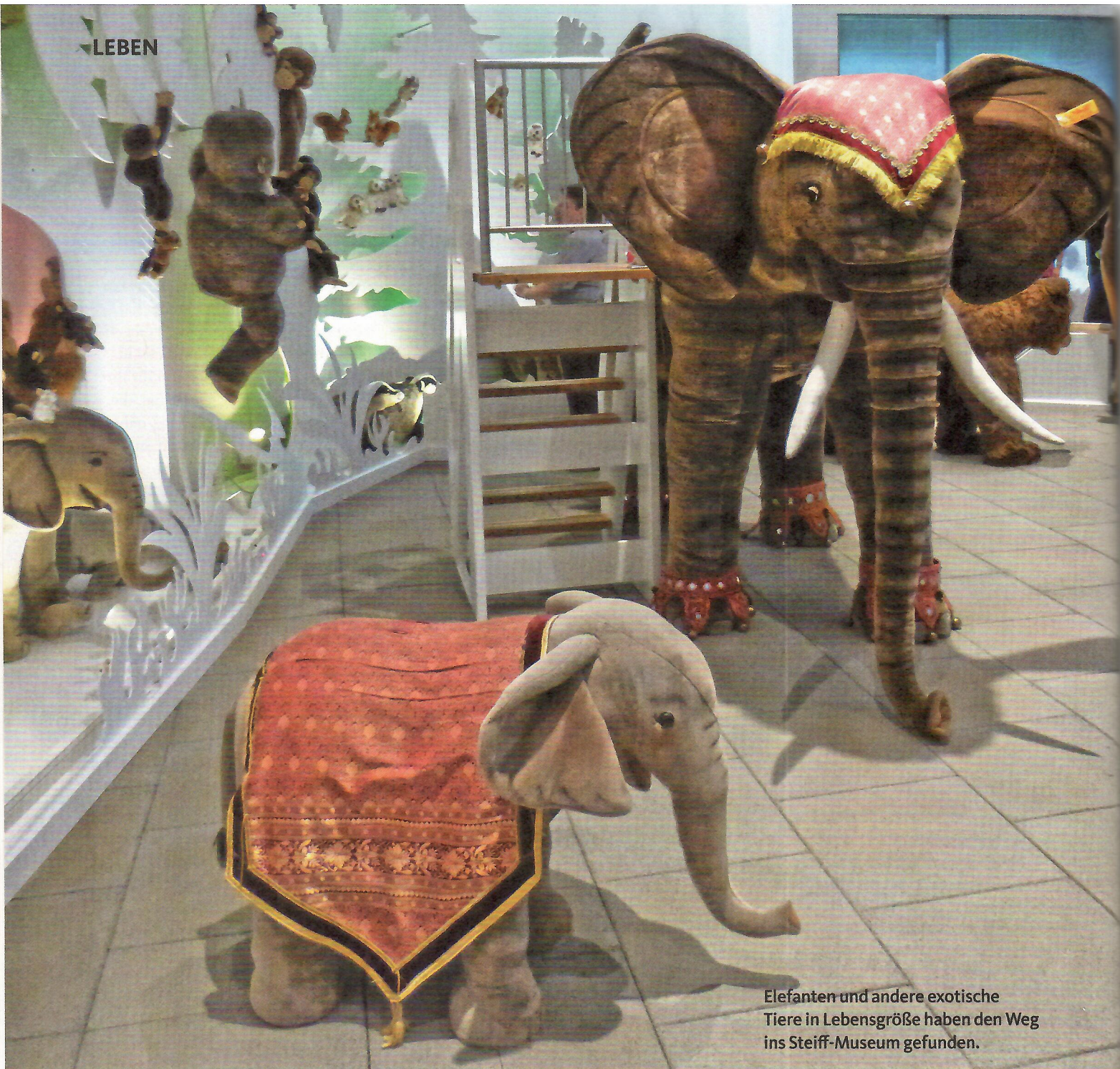
Elefanten und andere exotische Tiere in Lebensgröße haben den Weg ins Steiff-Museum gefunden.