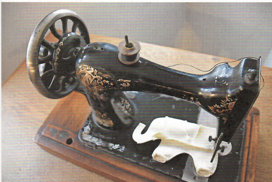
Zeitreise im Margarete Steiff Museum: Mit dem „Elefantle“ aus Filz fing alles an (ganz oben). Margaretes erste Nähmaschine kaufte ihr schon früh der Vater. Das Plakat von 1913 wirbt für die „weichgestopften Tiere“ bereits mit dem Gütesiegel „Knopf im Ohr“.