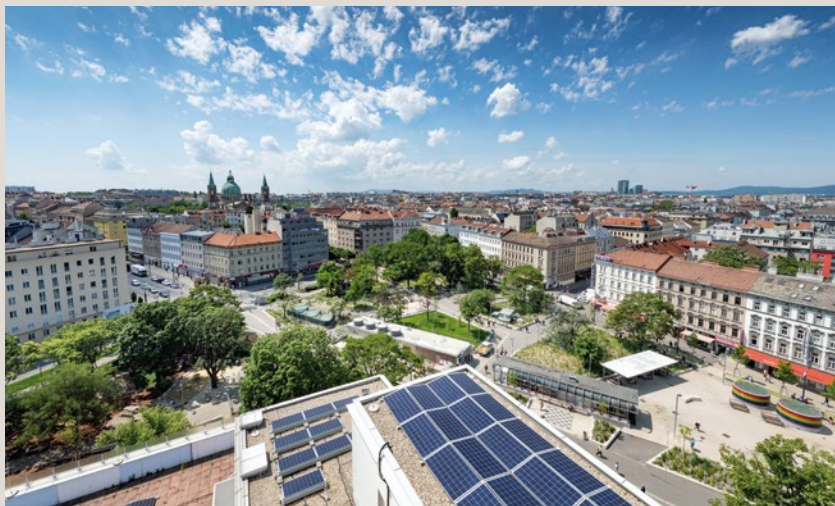
Auf jedem Gebäude der Stadt Wien, wo es technisch möglich und sinnvoll ist, werden in den nächsten Jahren Photovoltaikanlagen installiert.

In 80 Prozent der Neubaugebiete in Wien wird heute kein Öl oder Gas mehr eingesetzt.