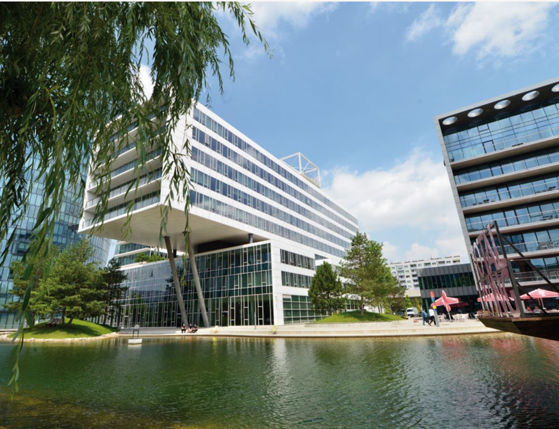
Das Stadtquartier „Viertel Zwei“ wird mittels Anergienetz klimafreundlich geheizt und gekühlt.

Zum Projekt: Das „Viertel Zwei“ ist ein energietechnologisch außergewöhnliches Stadtteilprojekt. Das „Kraftwerk Krieau“ versorgt über ein Anergienetz das Quartier mit Wärme und Kälte, die Gebäude tauschen Energie zwischen den Gebäuden aus. Im ersten Betriebsjahr