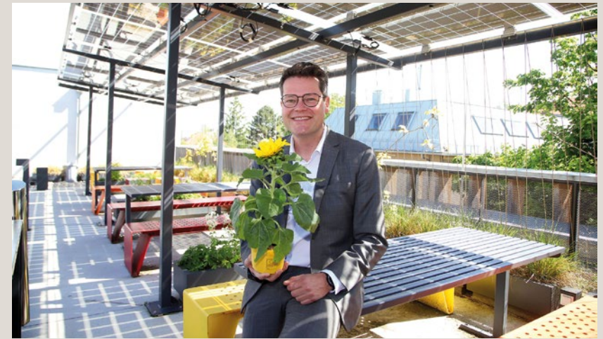
Wien hat die größte Photovoltaik-Offensive der Geschichte ins Leben gerufen. Bis 2030 soll die Sonnenstromleistung auf 800 MW p erhöht werden.

Die größte und wichtigste Herausforderung ist, unsere Wirtschaft und unsere Gesellschaft demokratisch so zu transformieren, dass das Klima nicht weiter geschädigt wird. Wir spüren bereits jetzt die Auswirkungen des Klimawandels. Die Sommer werden heißer, Extremwetterereignisse wie Dürren oder Hochwasser werden häufiger. Und es gibt einen klaren Weg, wie wir dem entgegenwirken können. Wir müssen unseren CO 2 -Ausstoß senken. In Wien haben wir uns zum Ziel gesetzt, bis zum Jahr 2040 klima-