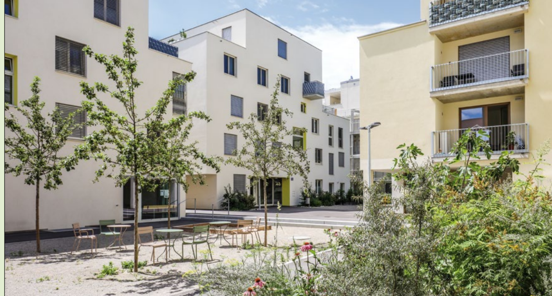
Die Wohnhausanlage MGG22 wird durch ein Erdsondenfeld klimafreundlich geheizt und gekühlt.

Die Umsetzung wäre vor allem im geförderten Wohnbau wesentlich attraktiver, wenn man die Kosten einer Wohneinheit ganzheitlich betrachten würde. Beim geförderten Wohnbau in Wien gibt es eine Deckelung der maximalen Mietkosten. Die Abfederung der Mehrkosten für die Herstellung des Energiesystems muss innerhalb dieses „Mietkostendeckels“ erfolgen. Hier ist meine Meinung: Die Verantwortlichen sollten über Alternativen nachdenken, etwa über Contracting-Modelle für die Herstellungsmehrkosten des Energiesystems.