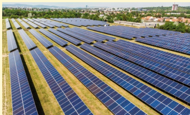
Am Wasserbehälter Unterlaa produziert eines der größten BürgerInnen-Solarkraftwerke Sonnenstrom für die Stadt.

Das solide Fundament steht. Die Grundlagenarbeit ist getan, nun geht es an die Erarbeitung von Maßnahmen, um die Energie- und Klimaschutzziele zu erreichen.