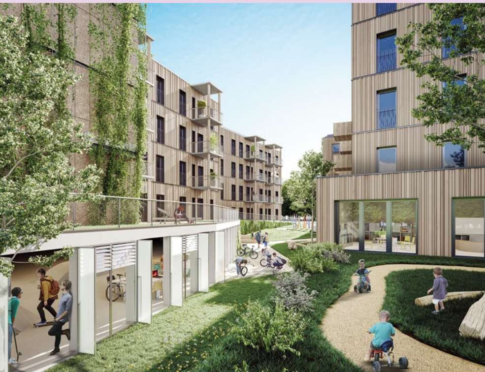
In der Waldrebgasse in der Wiener Donaustadt entsteht das Vancouver Haus: ein sozialer Wohnbau mit einem ausgeklügelten, auf erneuerbaren Energien beruhenden, Energiesystem.

Die Stadt Wien hat die Bereitschaft von anderen zu lernen, weil sie weiß, dass keine Stadt allein alle besten Ideen testen und ausprobieren kann. Dennoch bleibt Wien ein Leuchtturm für viele, denn Wiens Mission ist es, den BewohnerInnen eine bessere Stadt zu bieten, und Wien glaubt, dass diese nur erfüllt werden kann, wenn überall ein besserer Ort ist.