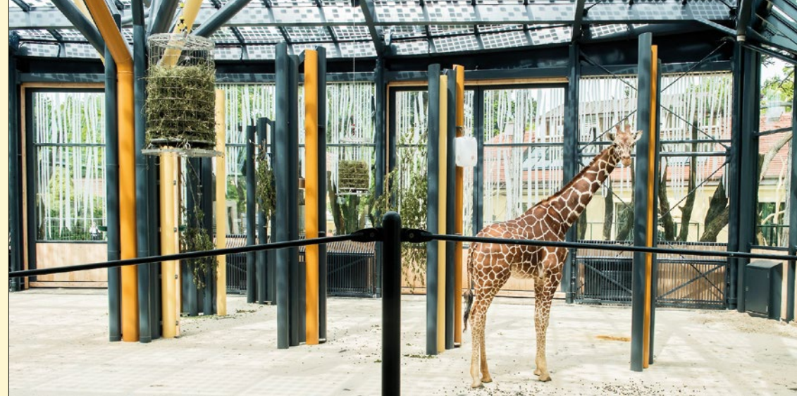
Photovoltaik-Module können mehr als nur Sonnenstrom produzieren. Im Tiergarten Schönbrunn spenden die transparenten Module zudem Schatten im Giraffenhaus.

Aber die Energy!ahead-App bietet noch mehr: Vom Smartphone geführte Touren bieten einen interessanten Blick auf die ganze Stadt – so können zum Beispiel das Kleinwasserkraftwerk Nussdorf, sanierte Gründerzeithäuser, zahlreiche Plus-Energie-Häuser und stromproduzierende U-Bahn-Stationen in unterschiedlichen Routen entdeckt werden.