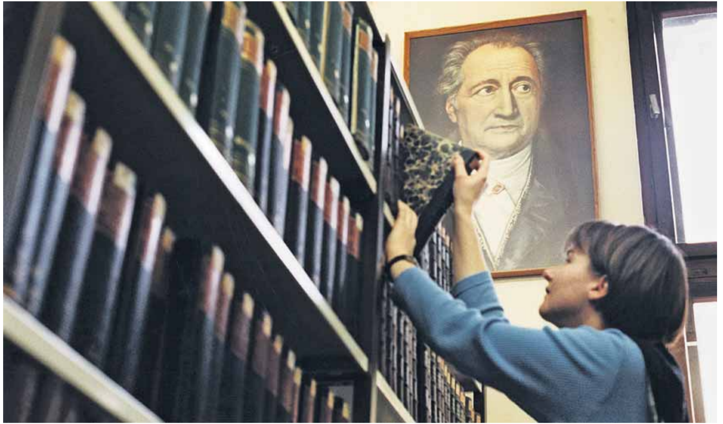
Goethe-Experten mit ausgedehnter Erfahrung im Lesen schwerer Folianten werden nur selten gesucht. Aber zunehmend verlangen Firmen nach Fachkräften, die Orientierung geben können.