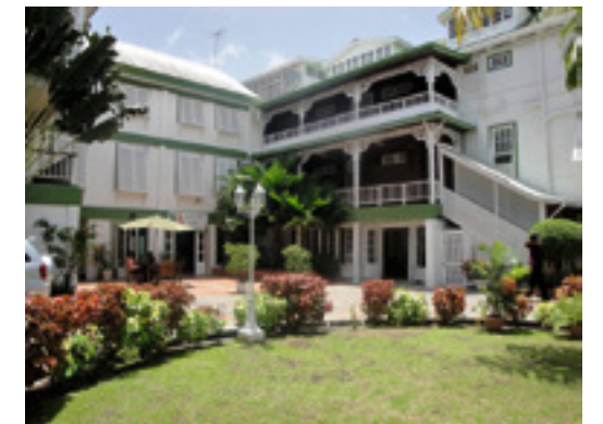
Charmanter Kolonialstil: Hotel Cara Lodge

Magisch: Die fast 250 Meter hohen Kaieteur Falls im Regenwald. Bild links: Veranda in der «Rock View Lodge»