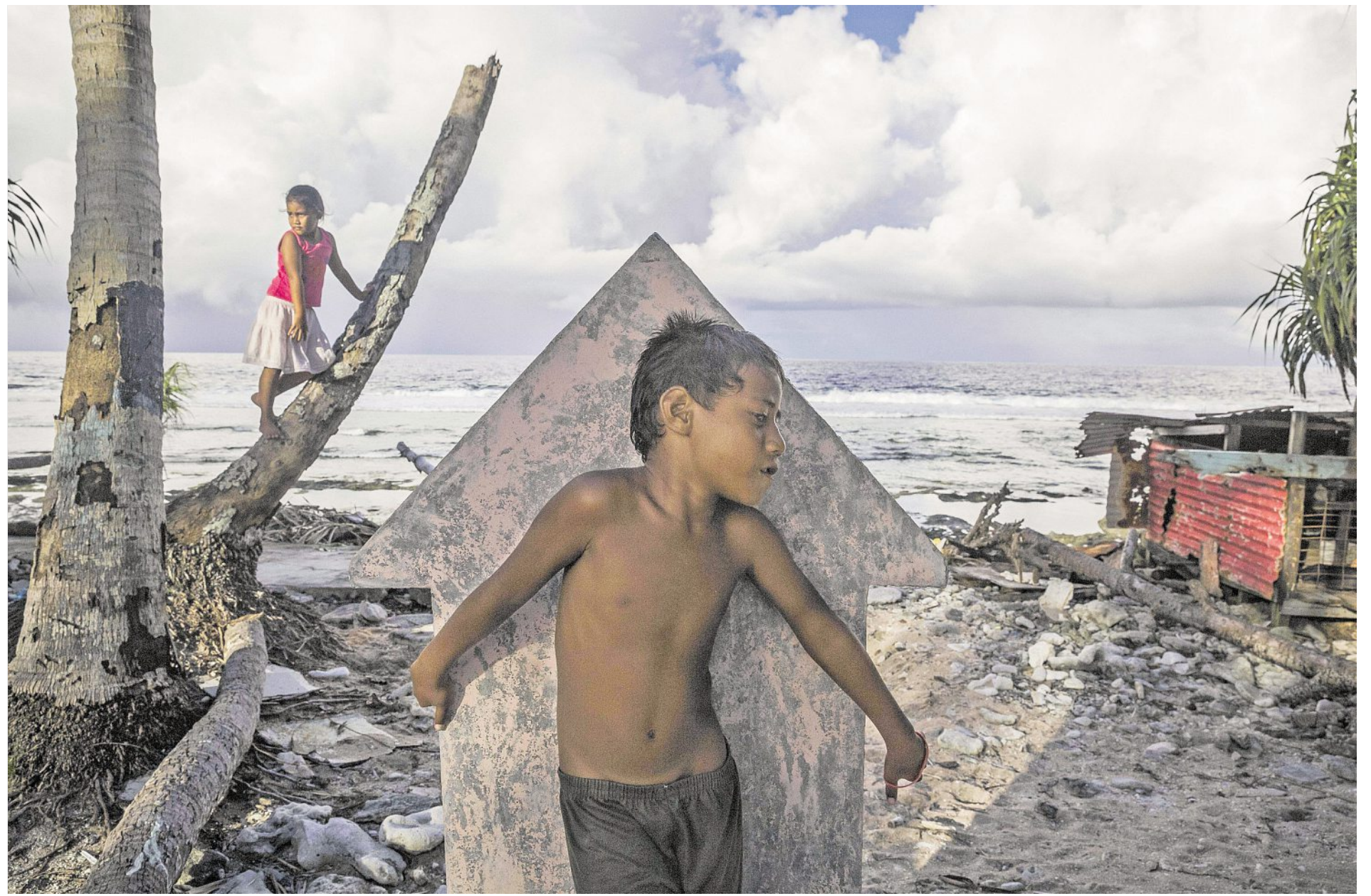
Kinder spielen auf dem alten Friedhof von Teone auf der Tuvalu-Insel Fongafale. Manche der alten Kokospalmen sind bereits Opfer des Meeres geworden.

„Wir sollten keinen Gedanken daran verschwenden, unsere Bevölkerung umzusiedeln, sondern dafür kämpfen, dass der Temperaturanstieg auf maximal 1,5 Grad begrenzt wird. Mit Anpassungsmaßnahmen wie Schutzmauern und Aufschüttungen müssen wir alles dafür tun, damit wir eine Zukunft in unserem eigenen Land haben“, sagt Tuvalus Premier Sopoaga. Er ist überzeugt, dass eine Umsiedlung seiner Be-