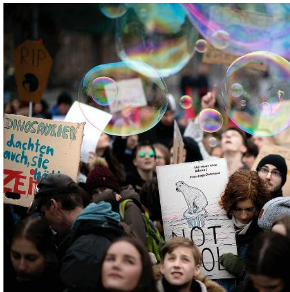
Klimaschutz-Demonstranten in Berlin: Panik, bitte!

Sie soll jetzt sagen, wie die Energiewende in Deutschland hinzukriegen und die Welt klimamäßig zu retten sei; zwei Kamerateams, vier Reporter, drei Fotografen warten. Sie kneift die Augen zusammen wie bei einer Migräne und sagt, mit zerkratzer Stimme, drei Worte: »I don't