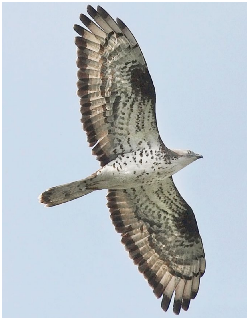
Der Wespenbussard ist im Gegensatz zum Mäusebussard ein sehr stiller Vogel.

Oder er plündert die in den Bäumen hängenden Wespennester. Dass ihn die erwachsenen Wespen summend und