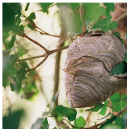
In Wespennestern befindet sich die Liebesspeise des Vogels: die Wespenlarven.