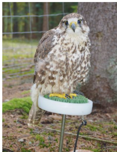
Schuppenähnliche, harte Federn am Kopf schützen den Wespenbussard vor den Stichen der Wespen.

Heutzutage können Wissenschaftlerinnen viele Vögel und auch Wespen-