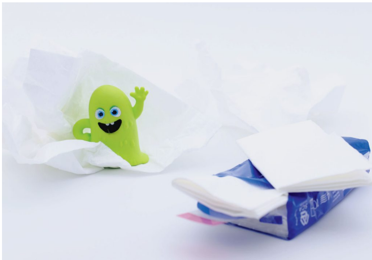
Wissenschaftler haben herausgefunden: Nieswolken fliegen weiter, als bisher gedacht.

Bei manchen Menschen löst sogar grelles Licht die Niesreaktion aus. Etwa jeder vierte Mensch erlebt das regelmässig, wenn er vom Dunkeln ins Helle oder in die Sonne geht. Wissenschaftler